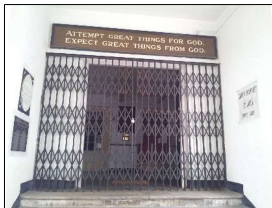
克理的名句刻在加尔各答教会的门上

1792年，克理宣讲了一篇划时代的信息，经文取自以赛亚书第五十四章2-3节：要扩张你帐幕之地，伸展你居所的幔子，不要缩回；要放长你的绳子，坚固你的橛子。因为你要向左向右开展，你的后裔必得列国为业，又使荒废的城镇有人居住。信息结束时，他还说了「 望神作大事，为神作大事 」这句话，感动了很多人的心，也成为传诵至今的名句，这段经文也成了他的座右铭。