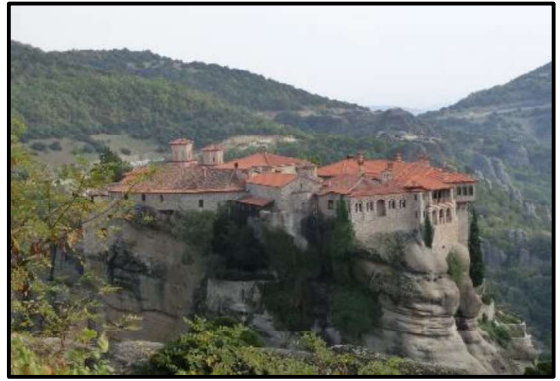
今天仍存在雅典的修道院

回顾过去，历史上曾出现数十次修道主义运动，其中有爱尔兰修会、本笃修会（Benedictines）、奥古斯丁修会等，以及所衍生的修道运动，又有从小亚细亚进入阿拉伯、印度，并有横过中亚进入中国的涅斯多